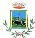
Tonezza del Cimone